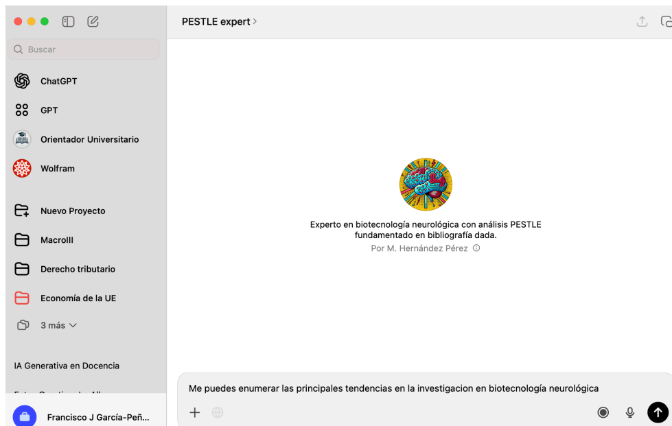
Figura 2. Interfaz y ejemplo de uso de uno de los GPT desarrollados

En la Figura 2 se puede ver en funcionamiento uno de los GPT realizado por uno de los grupos.