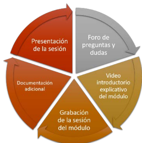
Figura 1. Contenido didáctico de cada módulo del Curso de “Gestión y Política Forestal en la Administración General del Estado”

Cada módulo contaba con el contenido didáctico que se muestra en la Figura 1: