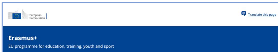
Figura 2. Plataforma de resultados de proyectos Erasmus+

resultados y evaluaciones obtenidos. En el caso de los proyectos de la acción clave 2, destinada a proyectos de cooperación, los resultados deben ser obligatoriamente subidos a la plataforma.