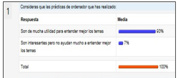
Figura 3: respuesta anónima de los estudiantes a la cuestión 1

La primera pregunta del cuestionario es la que nos puede dar más información sobre el posible impacto directo que ha tenido la realización de las prácticas sobre la comprensión de la materia impartida en la asignatura. Los resultados de esta cuestión se muestran en la figura 3: